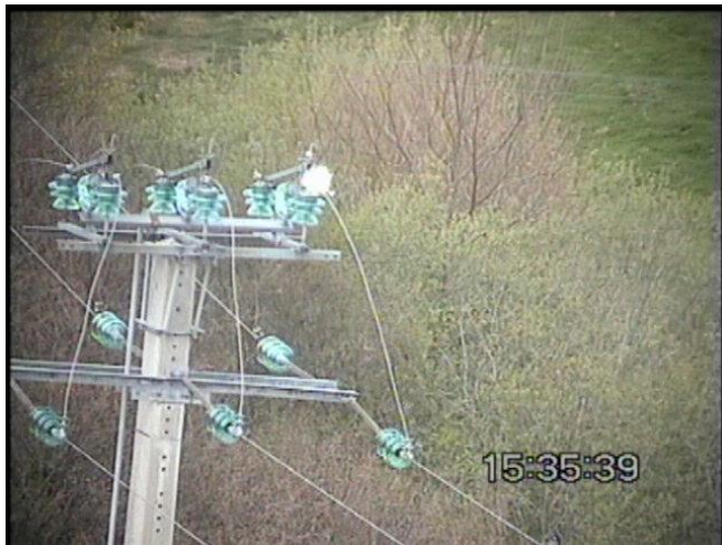
Corrosion de la tringlerie IACM 5146